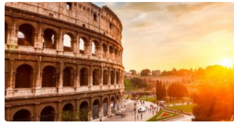
Excursii Optionale Civitavecchia