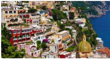
Excursii Optionale Napoli